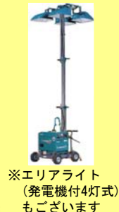
※エアライト(発電機付4灯式)もごさいます