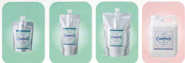
200mlパック 【濃度 100ppm】