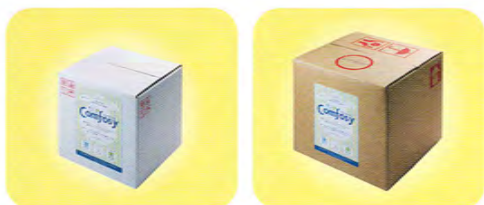
10リットルケース 【濃度 100ppm】