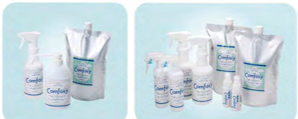
ゴーゴーセット【濃度 100ppm】 500mlスプレー、500mlポンプ、1,000mlパック 各1本