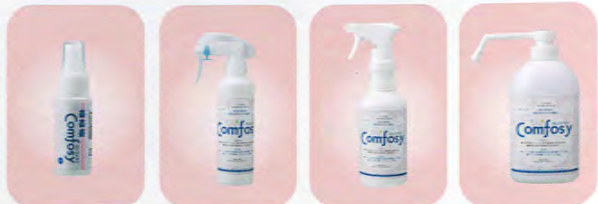
50mlスプレー 【濃度 100ppm】