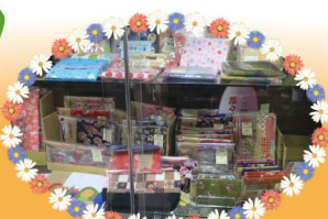
▼子ども達の手作り商品

普通の店頭で並んでいても 遜色のない仕上がり品々！ これが子ども達の手作りとは驚きです！ (しかも安い！)