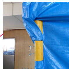
パッチンクリップ(黄): φ48.6用 ※ブルーシートをラップさせているので、パッチンクリップを2個使用