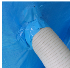
ダクト貫通部 ※養生テープで目張り

ブルーシートとカッター、パッチンクリップ、養生テープ、紐があれば、誰でも簡単に取り付けできます。