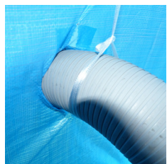
すいとる君ダクト ※紐で吊っています。