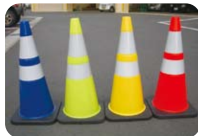
カラーバリエーション 全4色